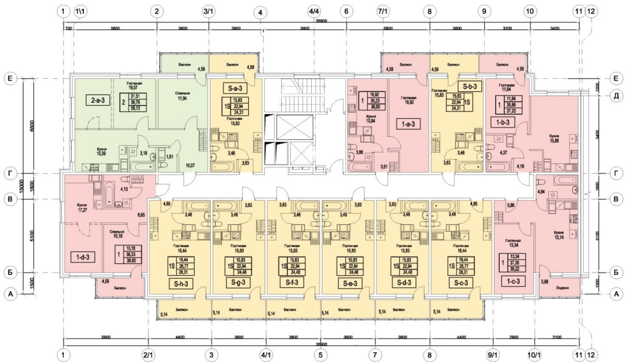
Секция "А". План типового этажа.